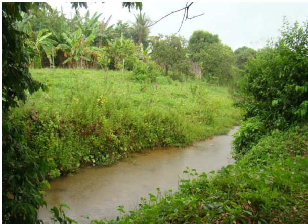
Figura 3 – Curso d'água importante para o município de Capela, como também para os assentados.

na recuperação ambiental das APPs, isto é, nas áreas de mata ciliar que se encontram em estado de degradação.