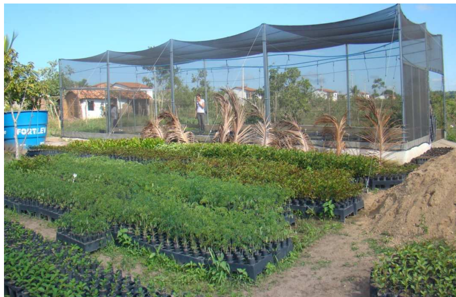
Figura 6 – Visão geral do viveiro florestal (parte interna e externa).