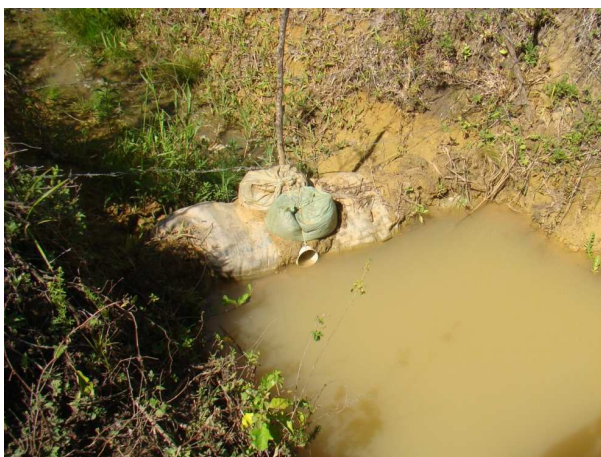
Figura 7 – Contenção feita pelos assentados.

Muitas famílias, mesmo sabendo que, de acordo com a lei 4771/65, os 30 metros de cada margem do rio deve ser preservada, não respeitam esse limite. Algumas famílias entrevistadas justificaram-se dizendo que não sabiam desse limite, outras falaram que nunca foram multados por isso, mas que sabem de tal lei. Apesar da aparente contradição, após várias visitas a campo e de participações em reuniões com técnicos do INCRA e assentados, foi comprovado que tal informação foi passada desde o início da divisão dos lotes e que, mesmo assim, alguns assentados continuam a degradar as áreas de preservação permanente.