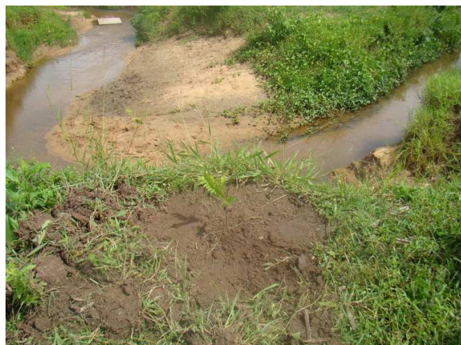
Figura 10 – Muda nativa plantada entorno do curso d'água.