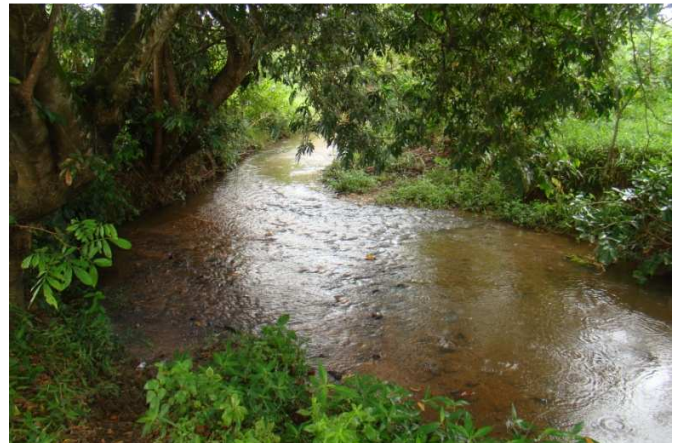
Figura 4 – Assoreamento do Rio Lagartixo.