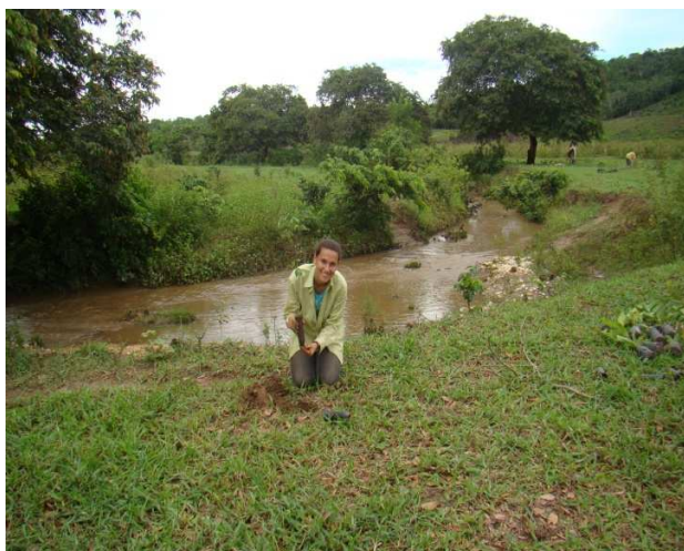
Figura 9 – Plantio de mudas nas APP, realizada pelo projeto de recuperação ambiental.

Por isso, foi desenvolvido o projeto de recuperação ambiental de áreas de preservação permanente, no Assentamento José Emídio dos Santos, que busca contemplar as diversas etapas necessárias para a conservação e preservação de nascentes, rios e lagos, desde a sensibilização dos assentados até a recuperação das áreas degradadas com replantio de mudas nativas e cercamento das mesmas (Figuras 09 e 10). É importante ressaltar que tais atividades sempre levaram em consideração os anseios dos assentados, havendo reuniões com os mesmos para saber a respeito do andamento do projeto.