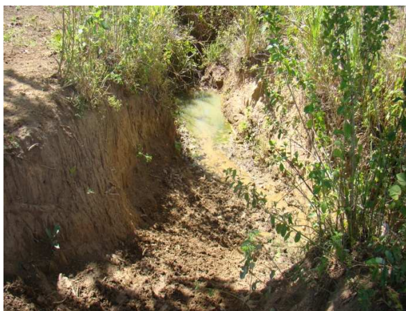
Figura 1 – Erosão das camadas do solo expostas ao intemperismo.

açúcar, e o pouco remanescente vem sendo explorado de forma ilegal para fins carvoeiros e madeireiros, conforme depoimentos das famílias assentadas.