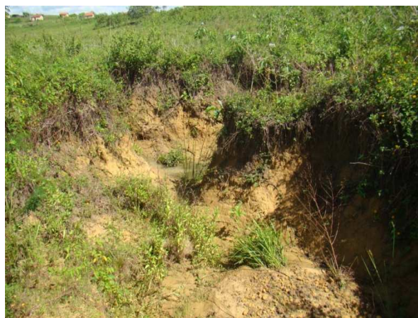
Figura 2 – Córregos sendo substituídos por áreas secas, cobertas por solo.