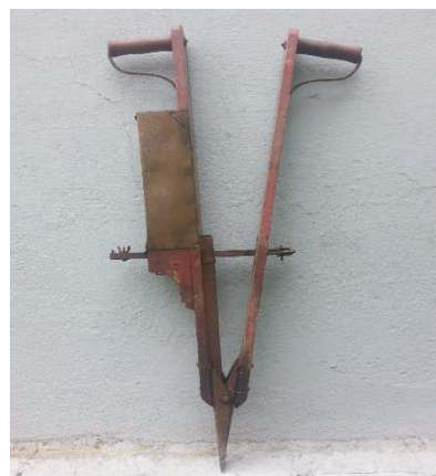
Fig. 3. saraquá, a muito tempo usada na semeadura

Em 1900 – 1920, as novas máquinas com rodagem permitiram que uma mesma força fizesse mais trabalho, e então o uso de tração animal se intensificou, em 1920 - 1950 os tratores foram de difundindo e isso deu liberdade à evolução das semeadoras, que foram se tornando maiores e mais pesadas. Em 1970 o