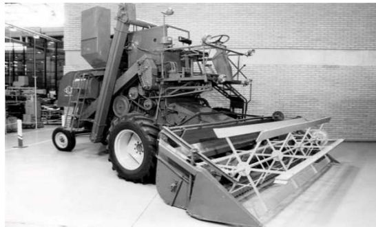
Fig.2. Colheitadeira SLC modelo 65-A

modernização das lavouras com grande plantio comerciais, contribuíram para que a colheita feita manualmente fosse feita por tais máquinas, dando início a essa evolução. Há 40 anos foi produzida a primeira colheitadeira automotriz no Brasil. O lançamento da colheitadeira SLC modelo 65-A (Fig. 2.), fabricada em Horizontina, foi feito no dia 5 de novembro de 1965. As colheitadeiras também eram conhecidas como ceifeira-debulhadora, esse nome era muito utilizado em Portugal, hoje as colhedoras são fundamentais no trabalho agrícola e diversas empresas estão sempre visando expansão nessa área.